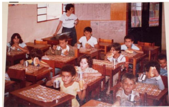
Primeira refeição do dia com alimentos produzidos na própria Fundamar