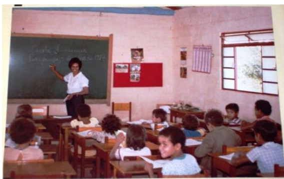
Sala de aula da E.E. Fundamar

O Centro de Referência do Professor, mantido pela Secretaria de Estado da Educação de Minas Gerais, está montando um Museu Virtual da Memória da Educação, disponível no site: http://crv.educacao.mg.gov.br . Para tanto solicitou das escolas mineiras que possuem acervo histórico que enviem fotografias para aquele Museu. Visando atender a este pedido a Escola Estadual Fundamar que tem um enorme arquivo de fotos não apenas da própria escola, mas de outras escolas visitadas nos municípios de Paraguaçu e Machado poderá dar uma boa contribuição. Há fotos resgatadas durante o trabalho de pesquisa que resultou na monografia: “Escolaridade dos Pais dos Alunos da Escola Fundamar: 2004” e também fotos do Projeto Fazenda Escola Fundamar nos idos da década 1980 ( fotos ).